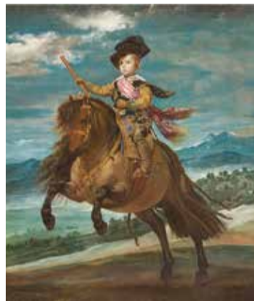
Diego Rodríguez de Silva y Velázquez, El príncep Baltasar Carles, a cavall, cap a 1635. Oli sobre tela.