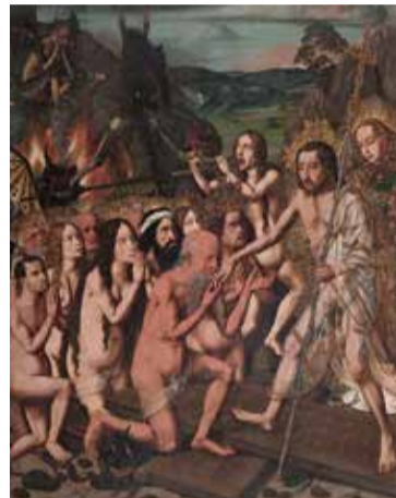
Bartolomé Bermejo, Devallament de Crist als Llirbs, cap a 1475. Museu Nacional d'Art de Catalunya