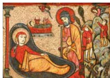
Johannes. Taller de la Ribagorça, Frontal de l'altar de Cardet, segona meitat del segle XIII. Museu Nacional d'Art de Catalunya