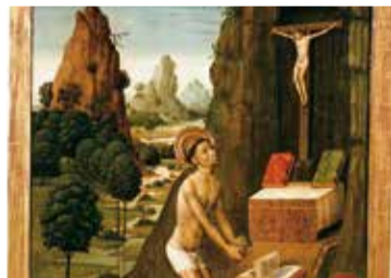
Mestre de la Seu d'Urgell, Sant Jeroni penitent (detall), cap a 1495. Museu Nacional d'Art de Catalunya