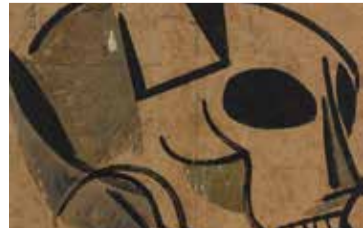
Josep Guinovart, Crani, 1954. Museu Nacional d'Art de Catalunya