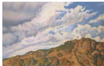
Nicolau Raurich, Terrer llevanti, cap a 1921. Museu Nacional d'Art de Catalunya