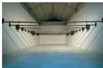
Jaume Plensa, Memoires Jumelles, 1992, bronze i ferro. Col·lecció MACBA. Fundació MACBA. Dipòsit particular