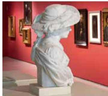
Rosend Nobas, Retrat d'Elisa Masriera, 1884. Museu Nacional d'Art de Catalunya