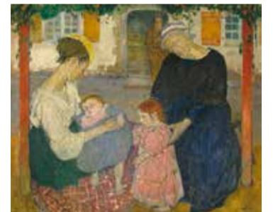
Mela Muter, La Santa Família, 1909. Museu Nacional d'Art de Catalunya