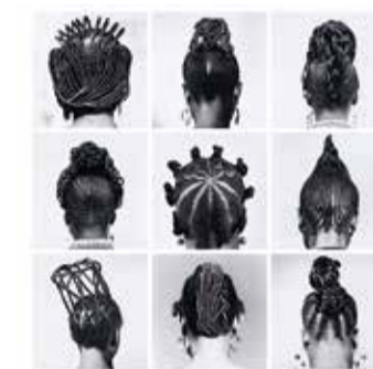
J.D. 'Okhai Ojeikere, Sense títol (Pentinat), 1970-1979. L'artista.