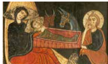
Frontal d'altar d'Avia (detall), cap a 1200. Museu Nacional d'Art de Catalunya

- Dv. 19/03: 16.30 h - Ds. 20/03: 11, 12.30 i 16.30 h - Dg. 21/03: 11 i 12.30 h - Preu: 10 €