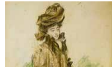
Ramon Casas, Retrat de Sada Yacco, 1902. Museu Nacional d'Art de Catalunya

- Dl. 08/02: 18.30 h - Preu: Amics 8 € | No Amics 10 €