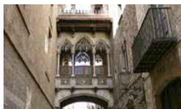
El pont del carrer del Bisbe

- Dc. 27/01, dj. 28/01, dc. 03/02 i dj. 04/02: 10.30 i 16.30 h - Ds. 30/01 i ds. 13/02: 10.30 h - Preu: Amics 20 € | No Amics: 30 € - Punt de trobada: escales de la plaça del Rei - Durada: 2 h aprox.