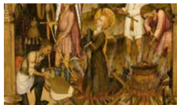
Martiri de santa Lúcia a la fogera, cap a 1435. Dipòsit de la Generalitat de Catalunya, Delegació Torres, 1995

- Ds. 20/02: 11, 12.30 i 16.30 h - Dg. 21/02: 11 i 12.30 h - Activitat gratuïta