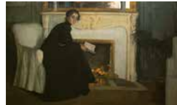
Santiago Rusiñol, Novel·la romàntica, 1894. Museu Nacional d'Art de Catalunya

- Dl. 22/03: 18.30 h - Preu: Amics 5 € | No Amics: 8 €