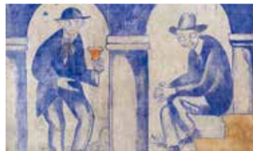
Xavier Nogués, Fragment de la decoració mural del celler de les Galeries Laietanes, 1915. Museu Nacional d'Art de Catalunya

- Ds. 16/01: 11, 12.30 i 16.30 h - Dg. 17/01: 11 i 12.30 h - Preu Amics: 10 €