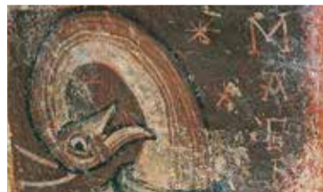
Mestre de Boí, Animal híbrid de Sant Joan de Boí, cap a 1100

- Ds. 23/01: 11, 12.30 i 16.30 h - Dg. 24/01: 11 i 12.30 h - Activitat gratuïta