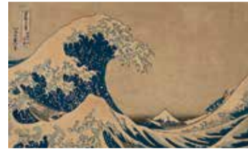
Katsushika Hokusai, Sota l'onada de Kanagawa, cap a 1832. Museu Nacional d'Art de Catalunya

- Dl. 25/01: 18.30 h - Preu: Amics 5 € | No Amics: 8 €