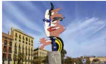
Roy Lichtenstein, Cap de Barcelona

- Dc. 10/03, dj. 11/03, dt. 16/03 i dj. 18/03: 10.30 i 16.30 h - Ds. 13/03 i ds. 27/03: 10.30 h - Preu: Amics 20 € | No Amics: 30 € - Punt de trobada: metro L3, parada Drassanes (rambla de Santa Mònica) - Durada: 2 h aprox