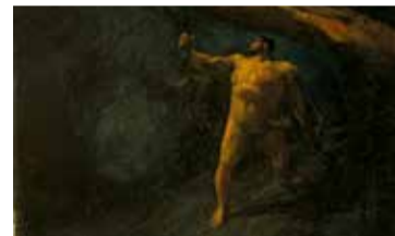
Aleix Clapés, Hèrcules buscant les Hespèrides, 1890. Museu Nacional d'Art de Catalunya

- Dj. 11/02: 18.30 h - Preu: Amics 8 € | No Amics 10 €