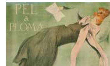
Ramon Casas, Pèl i ploma, 1899