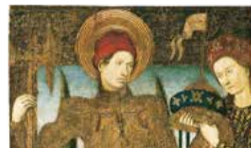
Sant Jordi i la princesa, tercer quart del segle xv