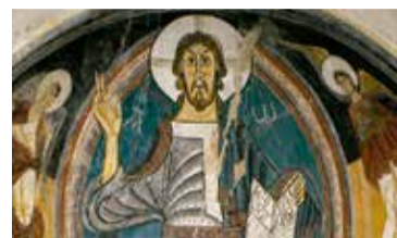
Mestre de Taüll, absis de Sant Climent de Taüll (detall), cap a 1123