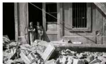
Antoni Campaña. Sense títol (Dues dones després d'un bombardeig), Poble-Sec, Barcelona, 14 de març de 1937. Arxiu Campaña