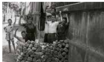
Antoni Campaña. Barricada infantil darrere de la Universitat de Barcelona, agost de 1936. Arxiu Campaña