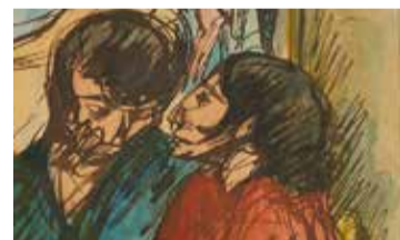
Isidre Nonell, Parella de gitanos, 1904. Museu Nacional d'Art de Catalunya