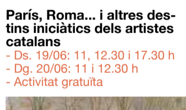
Santiago Rusiñol, La Butte, 1892