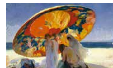
Lluís Masriera, Ombres reflectides, 1920