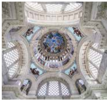
Sala de la Cúpula. Museu Nacional d'Art de Catalunya.

- Dv. 05/07: 10.30 i 12 h - Ds. 06/07: 10.30 i 12 h