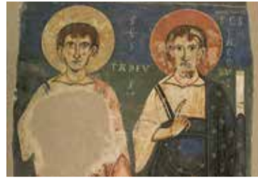
Mestre de Pedret, Apòstols d'Àger: Tadeu i Jaume , finals del segle XI - inicis del segle XII. Museu Nacional d'Art de Catalunya

- Ds. 14/09: 11, 12.30 i 17.30 h - Dg. 15/09: 11 i 12.30 h