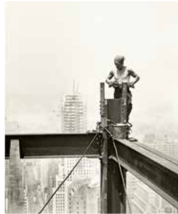
© Lewis Hine, On The Hoist , Empire State Building, 1931

- Dj. 05/09: 18.30 h - Lloc: Fundació Foto Colectania (Passeig Picasso, 14) - Activitat gratuïta