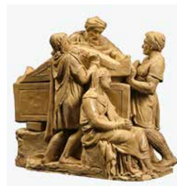
Damià Campeny, Enterrament de Crist , 1816. Museu Nacional d'Art de Catalunya

- Dv. 13/09, ds. 14/09, dv. 20/09, ds. 21/09, dv. 27/09 i ds. 28/09: 9-19 h - Preu Amics: 70 € / Preu no Amics: 90 € (autocar, visites i dinar inclòs)