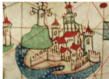
Carta portolana. Jaume Bertran. 1489. Biblioteca Nazionale Centrale. Firenze

- Dc. 10/07, dv. 12/07: 17 i 18.30 h - Ds. 13/07: 10.30 i 12 h - Lloc: MUHBA (Plaça del Rei, s/n) - Preu: 7 €