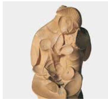
Pablo Gargallo, Maternitat , 1922. Museu Nacional d'Art de Catalunya

- Ds. 28/09: 11, 12.30 i 17.30 h - Dg. 29/09: 11 i 12.30 h