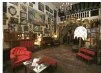
Taller d'Oleguer Junyent

- Dt. 17/09: 11 i 12.30 h - Dj. 19/09 i dj. 26/09: 17 i 18.30 h - Lloc: Bonavista, 22 - Preu: 10 €